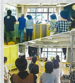
「おおきな樹」の視察