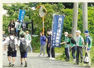
登校時のあいさつ運動の様子

玄関先で庭の手入れをする人や、畑で作業をする人を見かけると「こんにちは、お花がきれいですね」「ご精が出ますね」などと、見知らぬ者どうしでも昔は声を掛け合ったものです。声を掛け合い双方の人柄に触れることで、心が和むなど地域の防犯にもなっていたのだと思います。