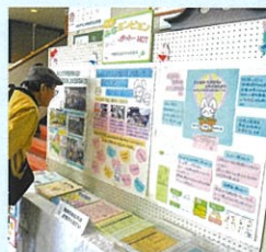
公民館まつりにて