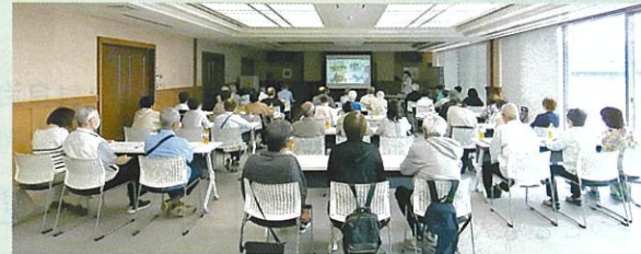
児童福祉専門部会の研修の様子